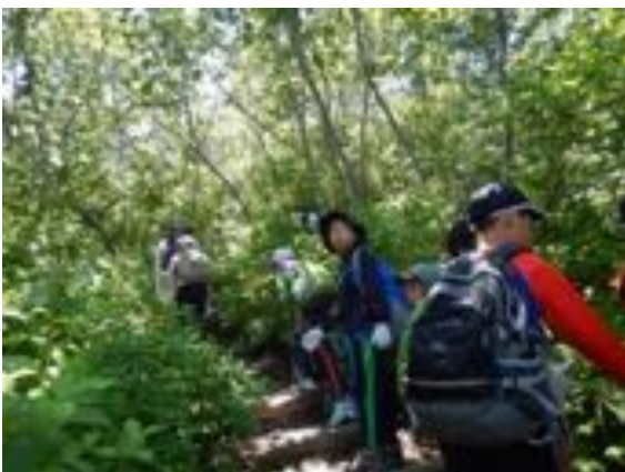
・登り始めの様子

イコロの森から車で1時間の「樽前山」。支笏湖のほとりにある樽前山。登り始めは周りを木に囲まれ細く、木の階段を通りますが、中盤以降は視界が開けて、支笏湖や近隣の山々の景色を眺めながら、溶岩ドームをみることが出来る山。車で45分の「紋別岳」。支笏湖の外輪山。頂上に鉄塔が立っているため、登山道は緩やかな林道。冬は下山時にソリで滑って帰って来られる山。