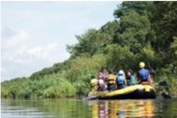
・美々川川下りの様子

イコロの森から車で45分の「支笏湖」。8年連続水質日本一に輝く支笏湖の水は「支笏湖ブルー」とも呼ばれ、とても美しく、とても冷たく、そしてとても栄養豊富です。その支笏湖湖畔で魚やエビ取りやフローティングなどの水辺の活動をします。