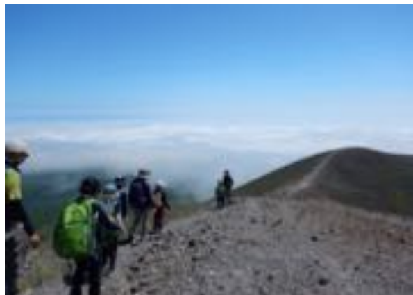
・中盤以降の様子