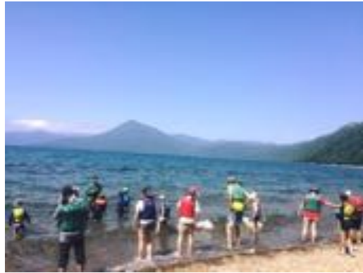
・支笏湖湖畔あそびの様子